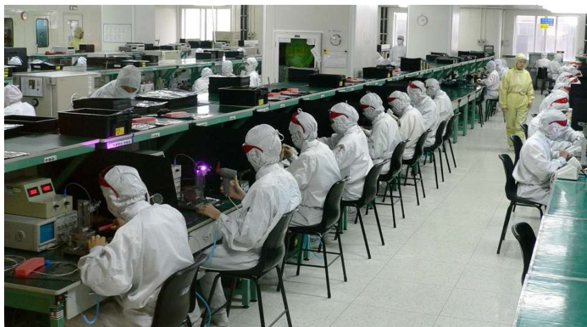
중국 선전의 생산 현장.